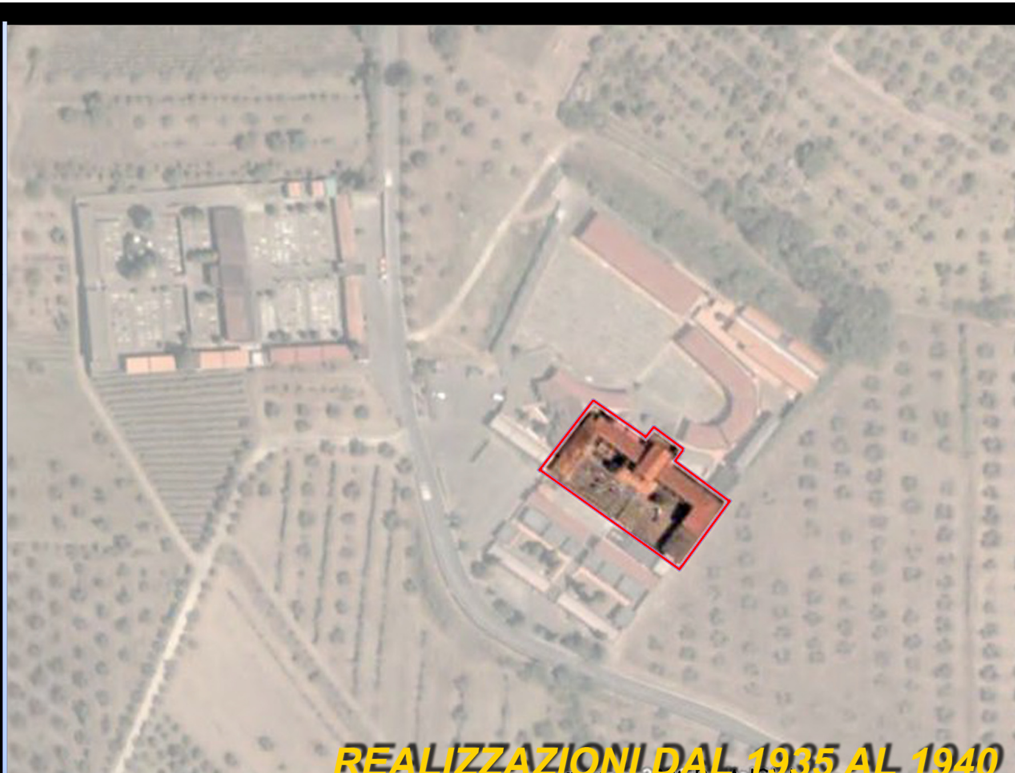
REALIZZAZIONI DAL 1935 AL 1940