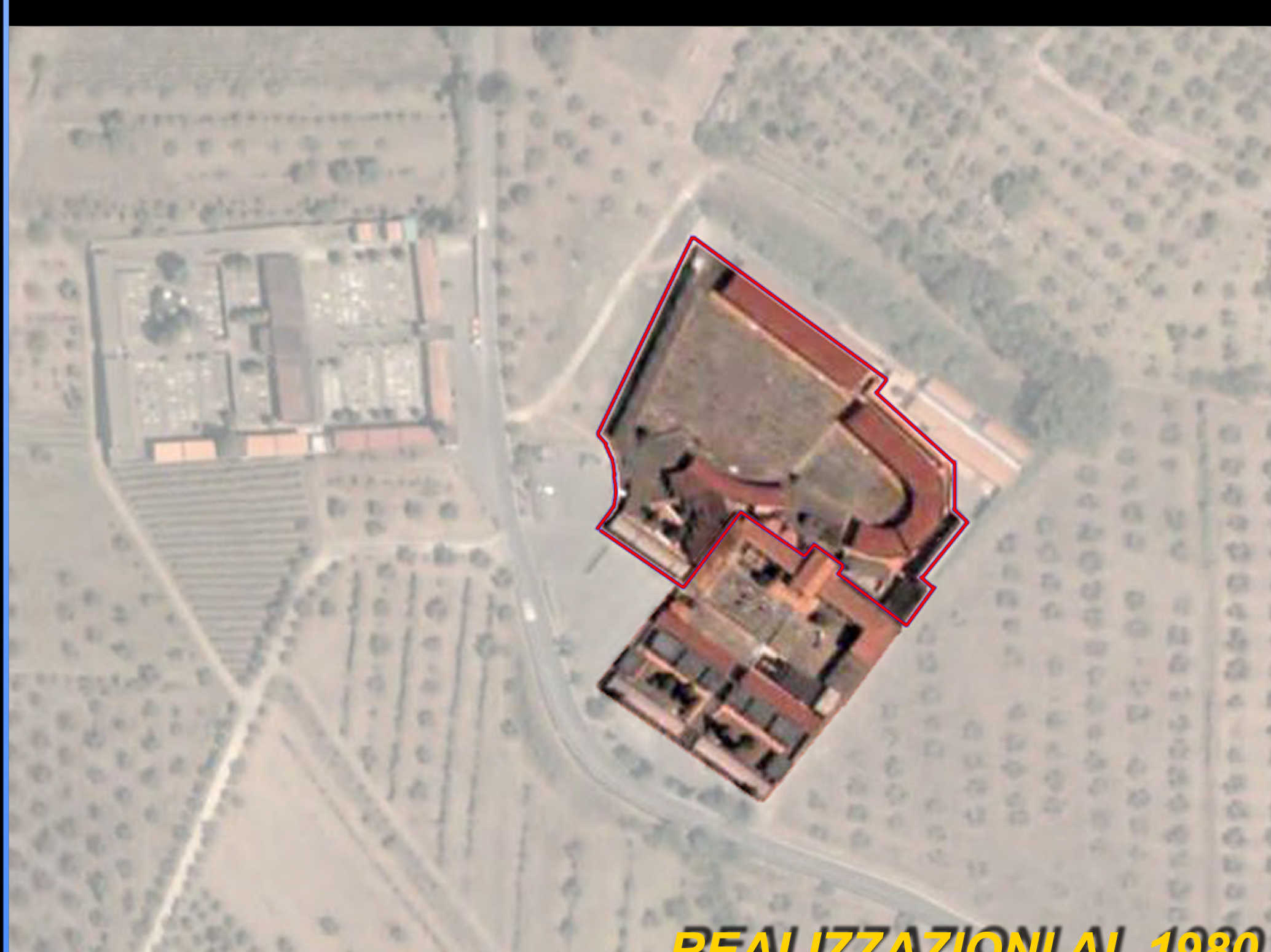
REALIZZAZIONI AL 1980