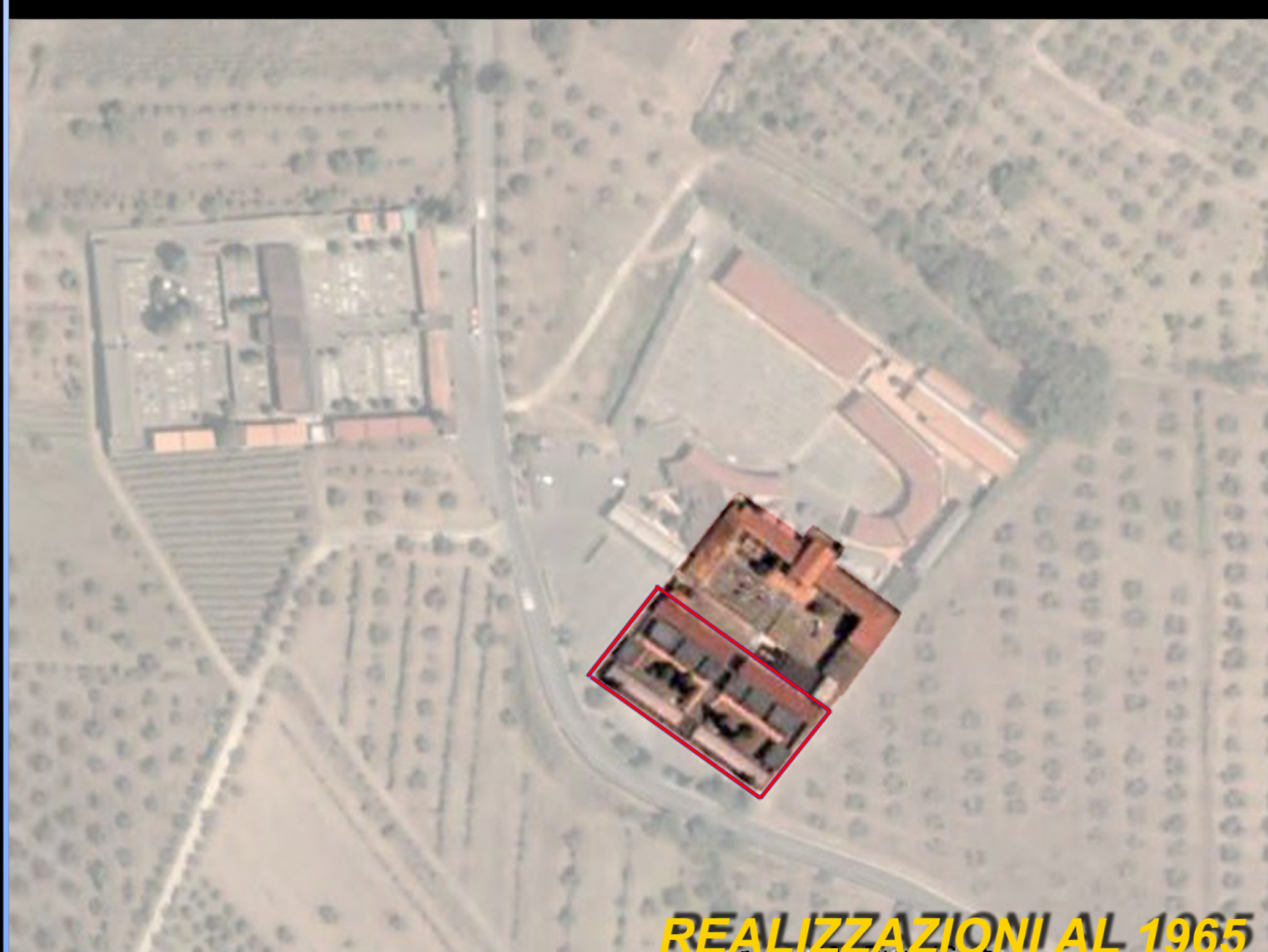
REALIZZAZIONI AL 1965