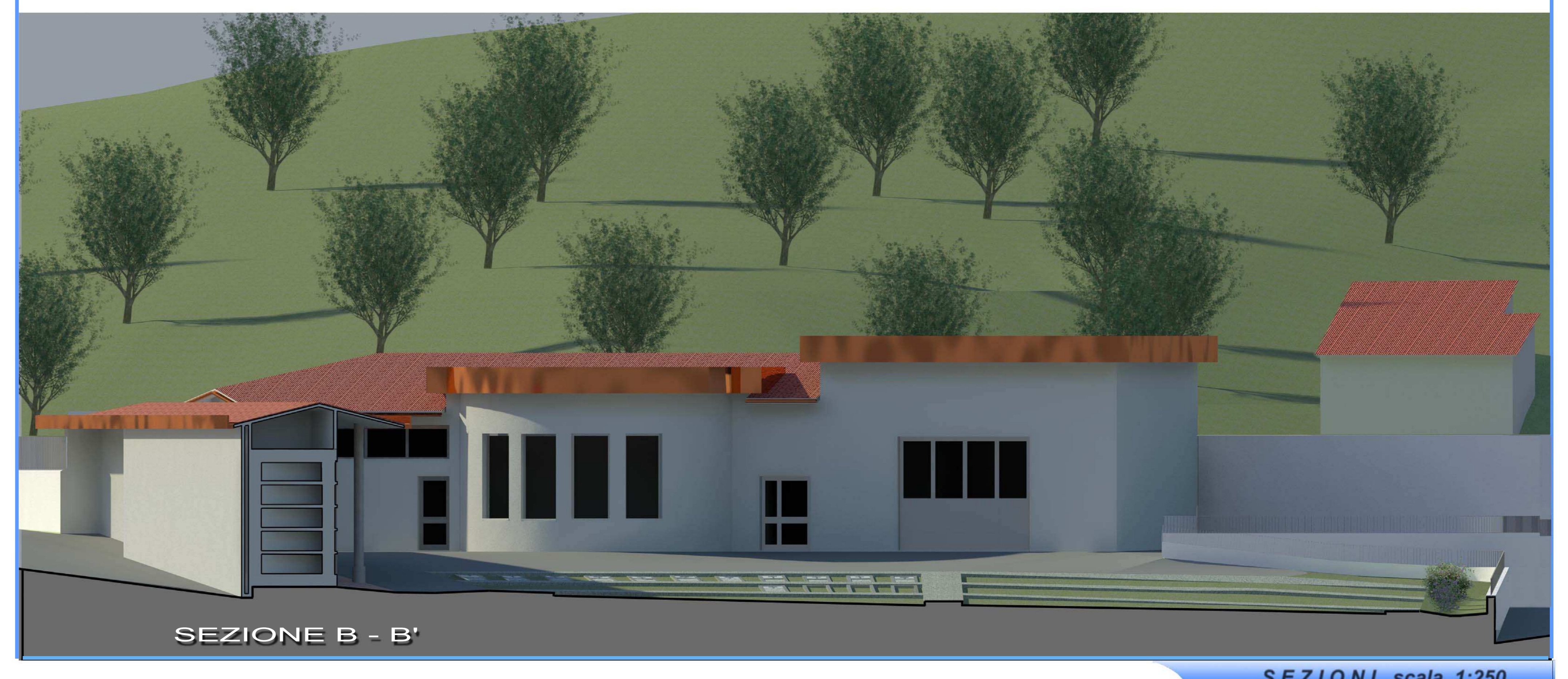
SEZIONI scala 1:250