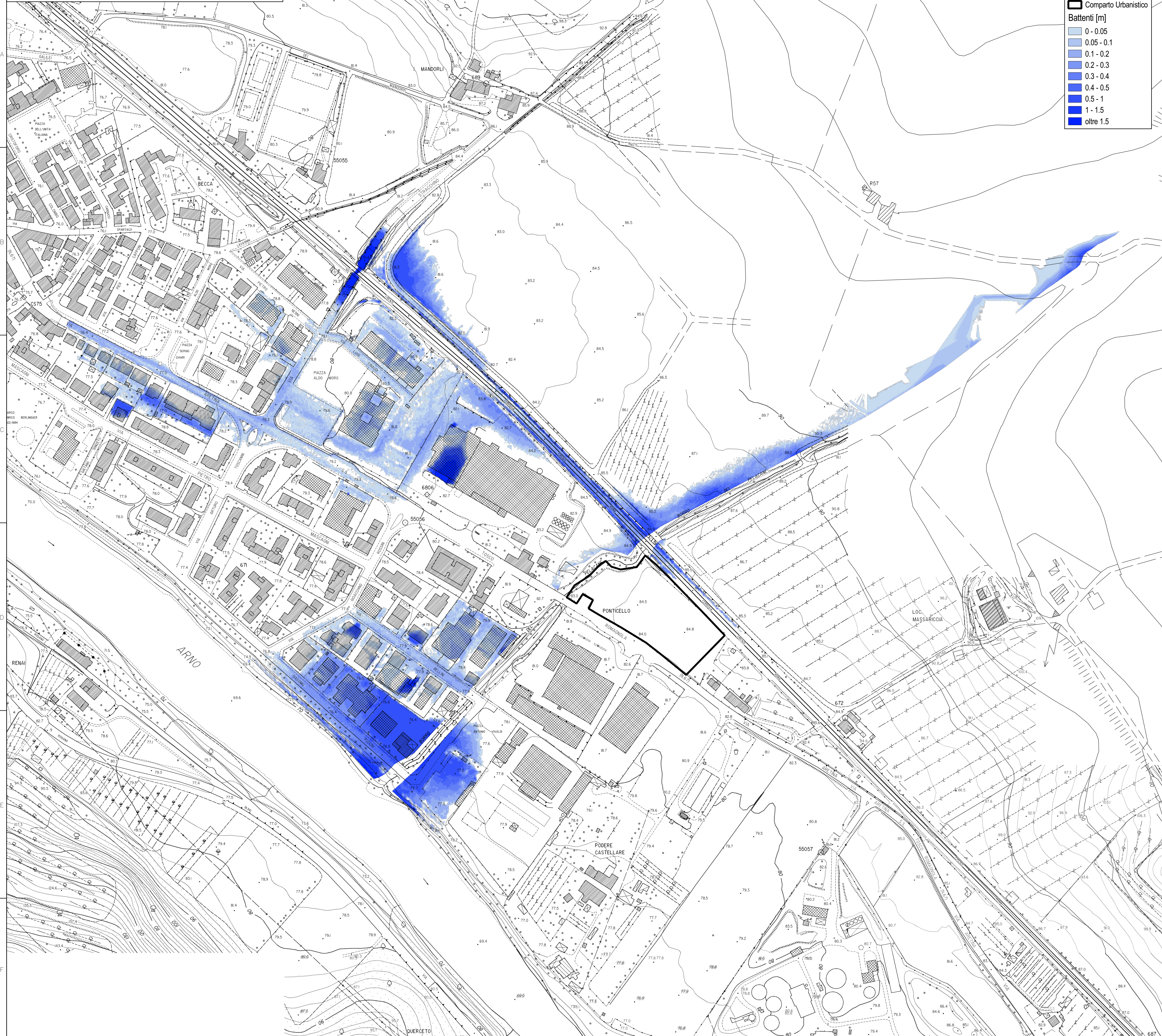
TAVOLA 6 PLANIMETRIA DEI BATTENTI IDRAULICI - INVILUPPO TR200 ANNI Scala 1:2000