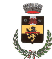
COMUNE DI PELAGO