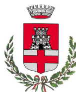
COMUNE DI PONTASSIEVE