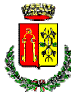
COMUNE DI RUFINA